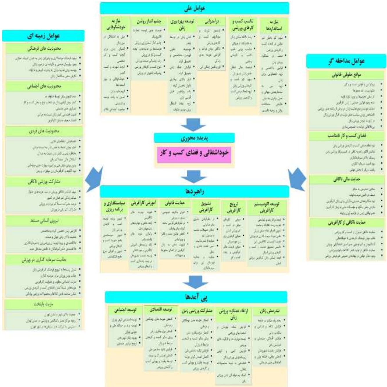
شکل ۲. الگوی تفصیلی توسعه کسب و کارهای ورزشی برای زنان در استان تهران