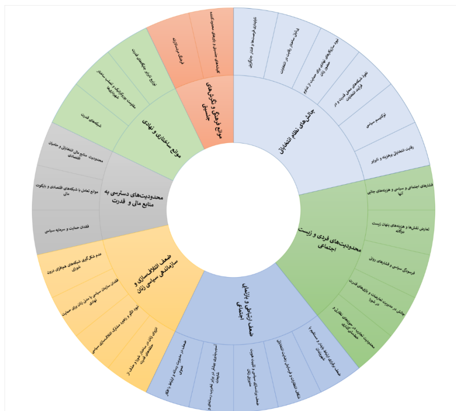
شکل ۲. علل ناپایداری و تک‌دوره‌ای بودن حضور زنان در شوراهای شهر استان تهران