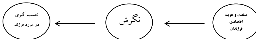
شکل (۱) مدل اقتصادی لیبشتاین

طبق نظر لیبشتاین، منافع و هزینه‌های فرزندان بر فرآیند تصمیم‌گیری عقلایی زوجین در مورد داشتن بچه، تأثیر می‌گذارد. وی سه نوع منفعت و دو نوع هزینه را در مورد فرزندان مطرح می‌کند. به طور کلی فرزندان در سه زمینه می‌توانند منشأ سود و منفعت برای والدین خود باشند. کالا بودن فرزندان به عنوان یک منبع لذت برای والدین، نیروی کار قلمداد شدن و تامین و نگهداری والدین در سنین کهولت یا وضعیت‌های دیگر مثل بیماری یا از کارافتادگی. هزینه‌های فرزندان نیز به دو دسته مستقیم و غیرمستقیم تقسیم می‌شود. هزینه‌هایی چون تعلیم و تربیت و آموزش، نگهداری و مراقبت‌های مختلف از فرزندان تا زمانی که به مرحله منفعت اقتصادی برسند، هزینه‌های مستقیم می‌باشند و هزینه‌های غیرمستقیم نیز در واقع مربوط به فرصت‌هایی است که مادران به خاطر نگهداری از فرزند خویش از دست می‌دهند. لیبشتاین نتیجه می‌گیرد که اگر منافع اقتصادی حاصل از وجود فرزند بیشتر از هزینه‌های دوگانه آن باشد، خانواده انگیزه پیدا می‌کند که فرزند بیشتری داشته باشد. او بر این باور است که در یک جامعه رفتارهای باروری ناشی از یک رفتار اقتصادی عقلایی است (حسینی، ۱۳۸۱: ۵۰-۵۱).