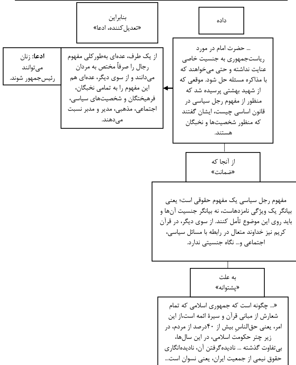
نمودار ۲. نمونه دو متن استدلالی از موافقان و مخالفان حق نمایندگی زنان در انتخابات ریاست‌جمهوری