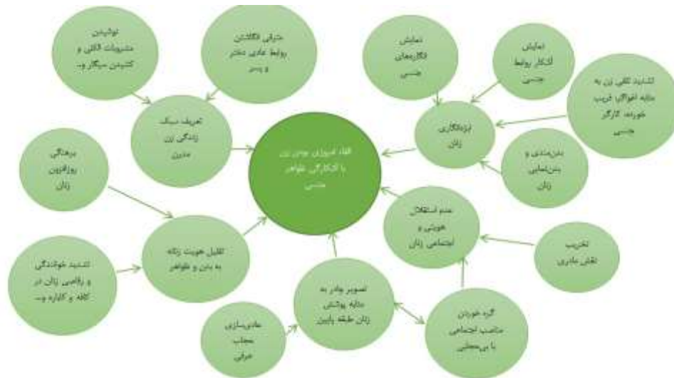
شکل ۳. گفتمان سوم

است. این خود، دال مرکزی گفتمانی ابژه‌انگاری زن را تأیید می‌کند. در مجموع «القای امروزی بودن زن با آشکارگی ظواهر جنسی» دال مرکزی در بازنمایی هویتی فیلم‌های این دوران بوده است. اگر همچون مکتب فرانکفورتی‌ها، صنعت فرهنگ‌سازی را به‌مثابه فریب توده‌ای در ذیل سیاست‌های فرهنگی سرمایه‌داری بدانیم، ارائه تصور مترقیانه از زن عریان و بی‌حجاب متمول و سرمایه‌دار، با همه ویژگی‌های تصویری فوق و عقب‌مانده نشان دادن پوشیدگی زنان طبقات محروم‌تر، کاملاً در این چارچوب می‌گنجد و هرگونه ارتقای اجتماعی و اقتصادی را منوط به پذیرش این سبک از زندگی می‌کند. از این منظر می‌توان همه ویژگی‌های فوق را به‌مثابه دال‌های پیرامونی یک دال مرکزی که صورت‌بندی کرد همان «القای امروزی بودن زن با آشکارگی ظواهر جنسی» است.