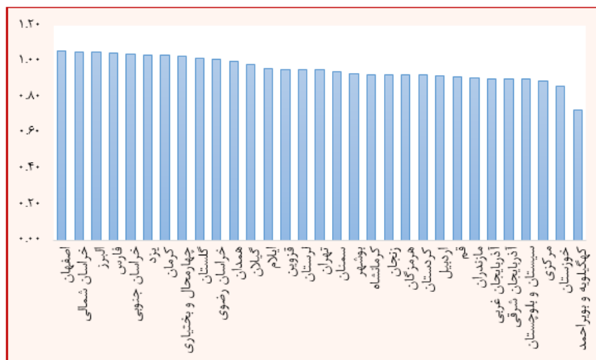
شکل ۱. مقایسه متوسط نسبت دانشجویان زن به مرد در استان‌های ایران: ۱۳۹۵-۱۴۰۱

و استان مرکزی کمترین میانگین نسبت مشارکت اقتصادی زنان به مردان را دارد در حالی که استان خراسان شمالی در دوره مورد بررسی بیشترین نسبت را به خود اختصاص داده است. علاوه بر آن، همان‌گونه که در شکل ۲ مشاهده می‌شود پراکندگی بیشتری در بین استان‌ها از منظر موقعیت زنان نسبت به مردان در این بعد نسبت به بعد آموزش مشاهده می‌شود. این در حالی است که با توجه به شکل ۳ بیشترین متوسط میزان خودکشی به ازای هر ۱۰۰ هزار نفر جمعیت به ترتیب متعلق به استان‌های کرمانشاه، ایلام و کهگیلویه و بویراحمد است. در حالی که استان سیستان و بلوچستان کمترین میزان خودکشی را به خود اختصاص داده است. ویژگی‌های فرهنگی و اعتقادی در کنار شرایط اقتصادی و اجتماعی هر استان می‌تواند در وقوع این پدیده نقش داشته باشد.