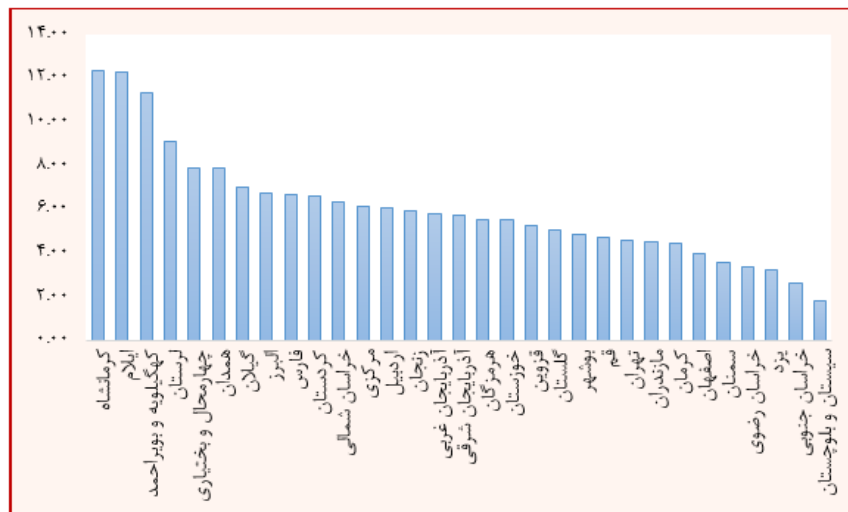
شکل ۳. مقایسه متوسط میزان خودکشی به ازای هر ۱۰۰ هزار نفر جمعیت در استان‌های ایران: ۱۳۹۵-۱۴۰۱